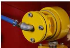
Bloc décompression & pression Arrêt immédiat air