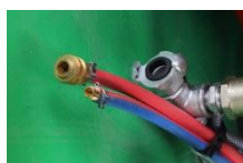
Coupleur rapide Pour Tuyau sablage