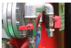
Bloc flux air Double sortie air