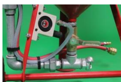
Vibreur Doseur a boisseau