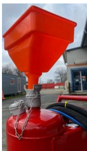
Entonnoir et bouchon pompier pour l'AMXT 12 ONE