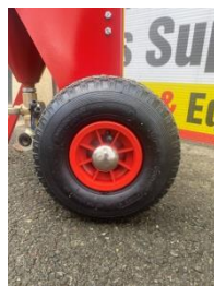
Roues de 22 cm