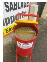
Couvercle et tamis pour l'AMXT 12 PRO