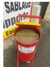
Couvercle et tamis