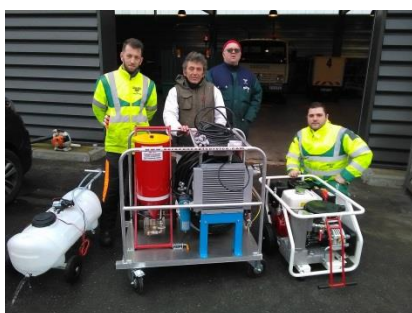
SKID AMXT 15 PRO