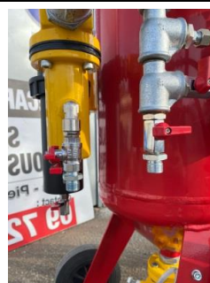
Branchement tous outils pneumatiques