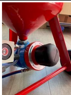
Option : Doseur abrasif piloté pneumatiquement