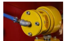
Bloc de dépressurisation