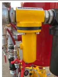
Filtre à charbon actif