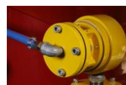
Bloc de dépressurisation