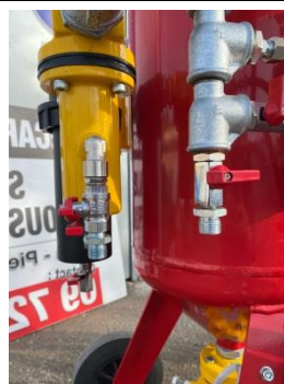
Branchement tous outils pneumatiques